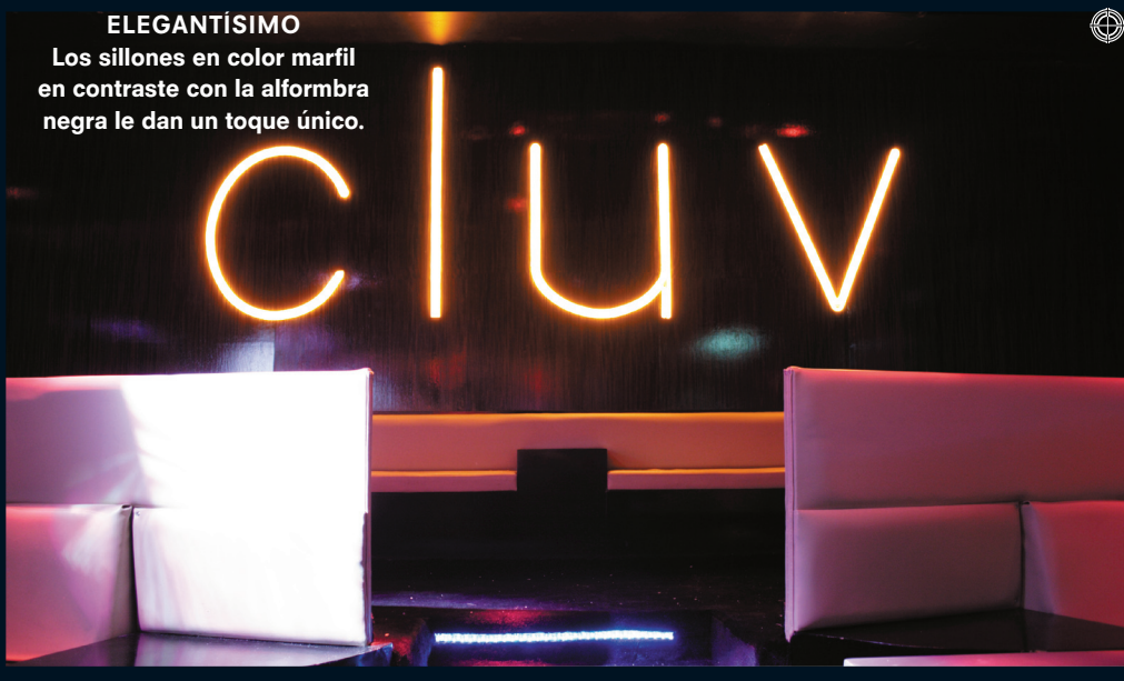
ELEGANTÍSIMO Los sillones en color marfil en contraste con la alfombra negra le dan un toque único.