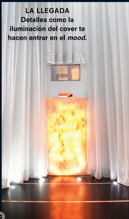
LA LLEGADA Detalles como la iluminación del cover te hacen entrar en el mood.