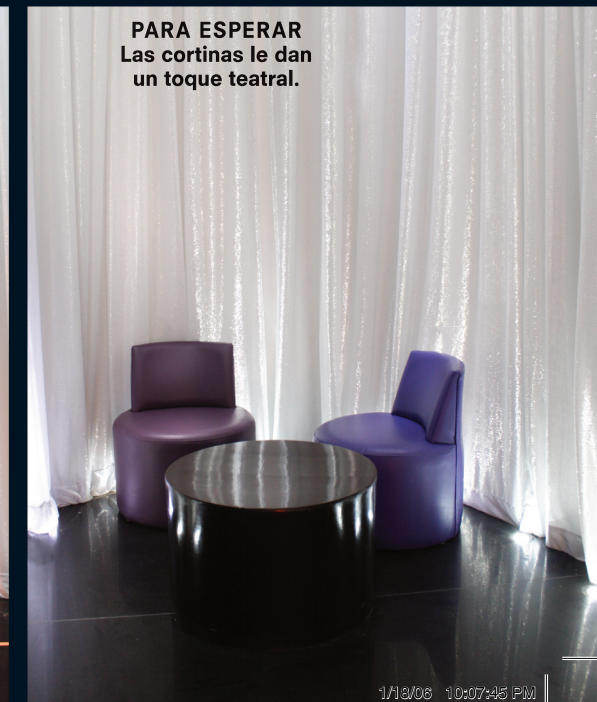
PARA ESPERAR Las cortinas le dan un toque teatral.