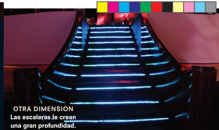
OTRA DIMENSION Las escaleras le crean una gran profundidad.