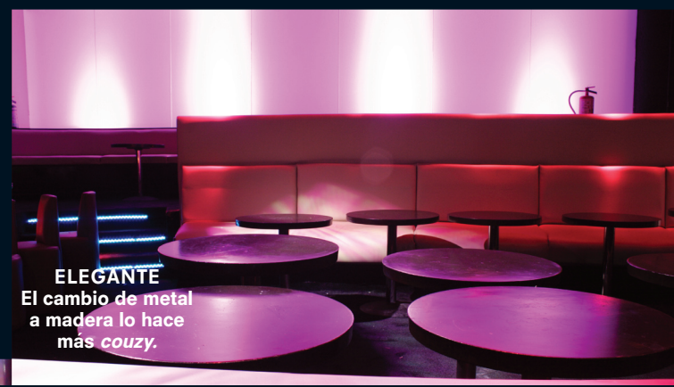
ELEGANTE El cambio de metal a madera lo hace más couzy .

los colores. Antes era un lugar que estaba en colores verde pistache y morados. Me acuerdo que la primera vez que me trajeron los clientes y lo vi prendido quedé impactado, en tu vida te hubieras imaginado que había esos colores; también tenía rojos, todo era muy a go-go y lo que traté fue brincarlos de esa época a algo más estilizado.