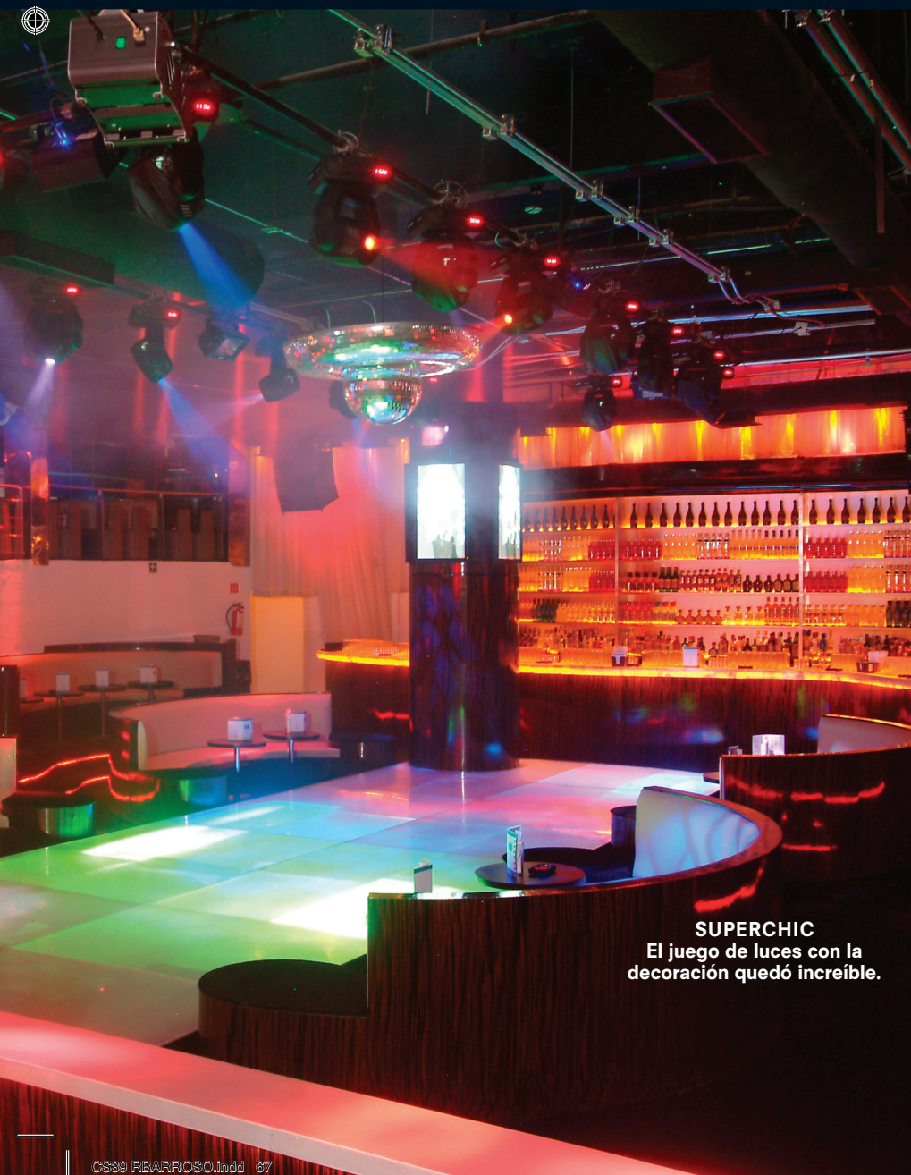
SUPERCHIC El juego de luces con la decoración quedó increíble.

Se farraron de la misma madera que el resto del lugar, que es mi favorita: el ébano de macasa. Es un tipo de madera exótica de la isla de Madagascar muy bonita, se puso ámbar y se cambiaron