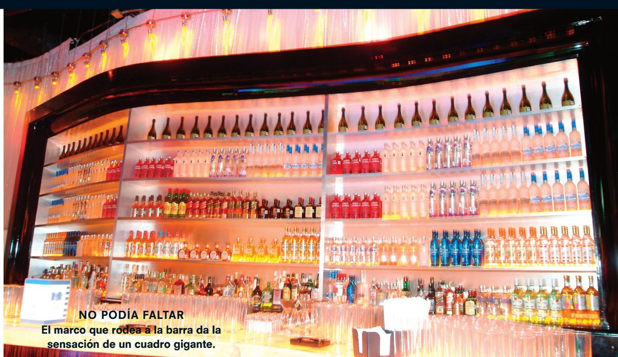
NO PODÍA FALTAR El marco que rodea a la barra da la sensación de un cuadro gigante.

Además de ser arquitecto soy proyectista, realmente rara vez te llevas sorpresas agradables cuando vez tu trabajo bien