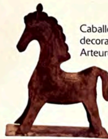
Caballo decorativo, de Arteuropeo.