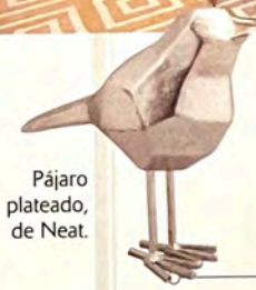
Pájaro plateado, de Neat.