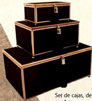
Set de cajas, de Arteuropeo.