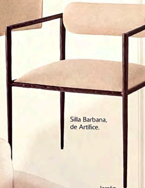
Silla Barbana, de Artifice.