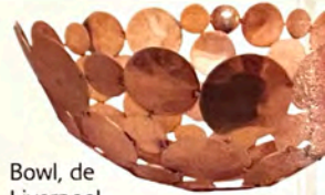
Bowl, de Liverpool.