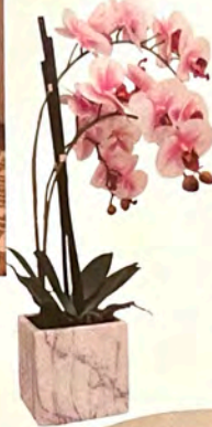
Lámpara de mesa Bell, de Ula Light.